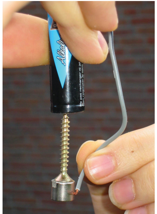
Abb. 1 Der Elektromotor im „Handbetrieb“.

Der aus Schraube und Magnet bestehende Rotor erfüllt zwei wesentliche physikalische Funktionen: Zum einen stellt er eines der für einen Elektromo-